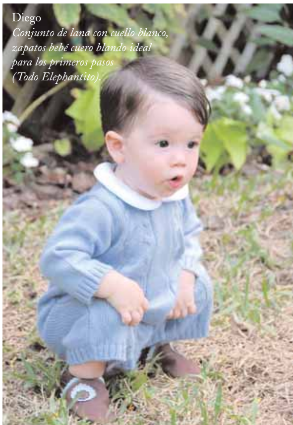
Diego Conjunto de lana con cuello blanco, zapatos bebé cuero blando ideal para los primeros pasos (Todo Elefantito).